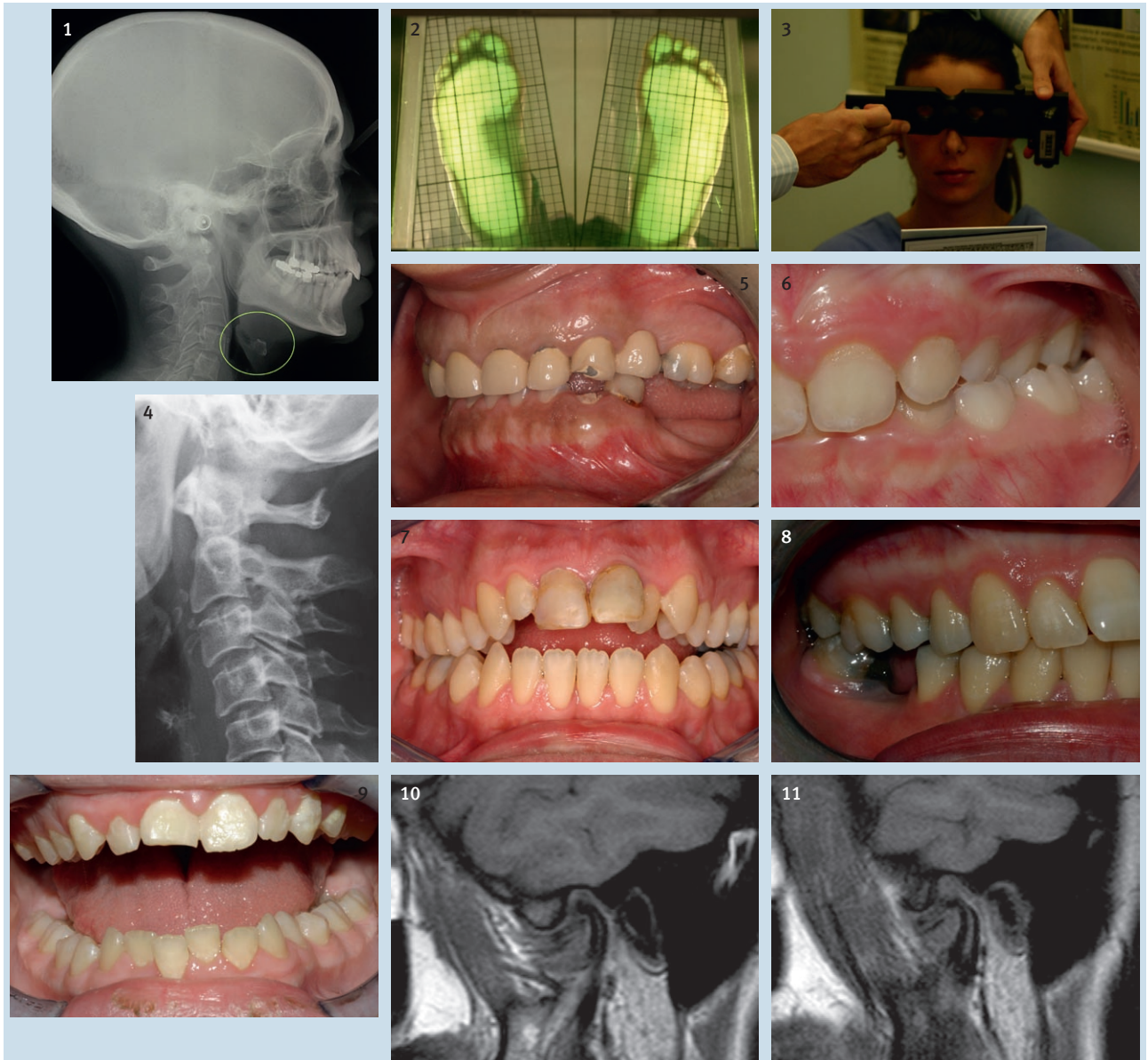
Slika 1 Latero-lateralna rendgenska snimka

Figure 1 laterolateral rx picture, the hyoid bone highlighted